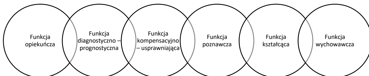
Rysunek 1. Funkcje wychowania przedszkolnego

Jedną z głównych funkcji wychowania przedszkolnego jest przygotowanie do kolejnych etapów edukacji w tym edukacji w ramach szkoły podstawowej i to na różnych obszarach rozwoju dziecka. Dlatego też można wyróżnić kilka funkcji przedszkola 2 . Są to: